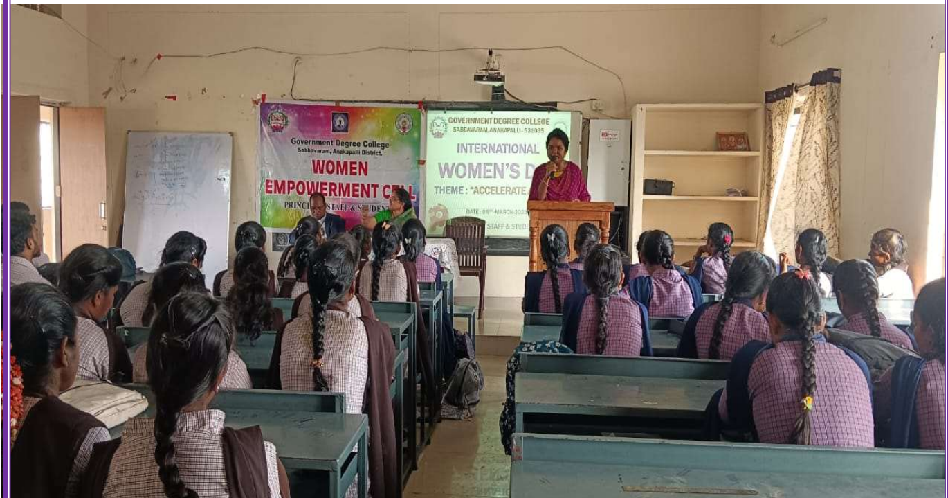
Smt.B.Lakshmi women empowerment coordinator giving speech