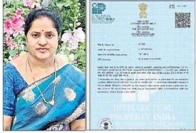
సీతాలక్ష్మికి దక్కిన ఇంటిల్లెక్చువల్ ప్రొఫెసర్ సర్టిఫికేట్